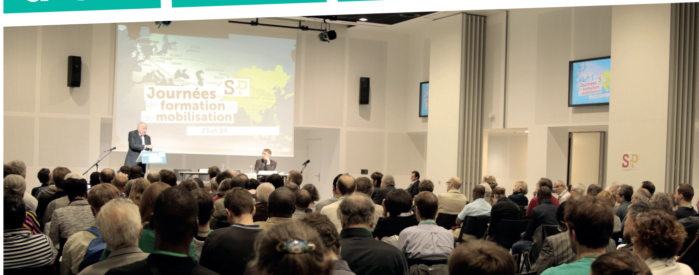
Ne pas jeter sur la voie publique svp

Créons des millions d'emplois productifs !