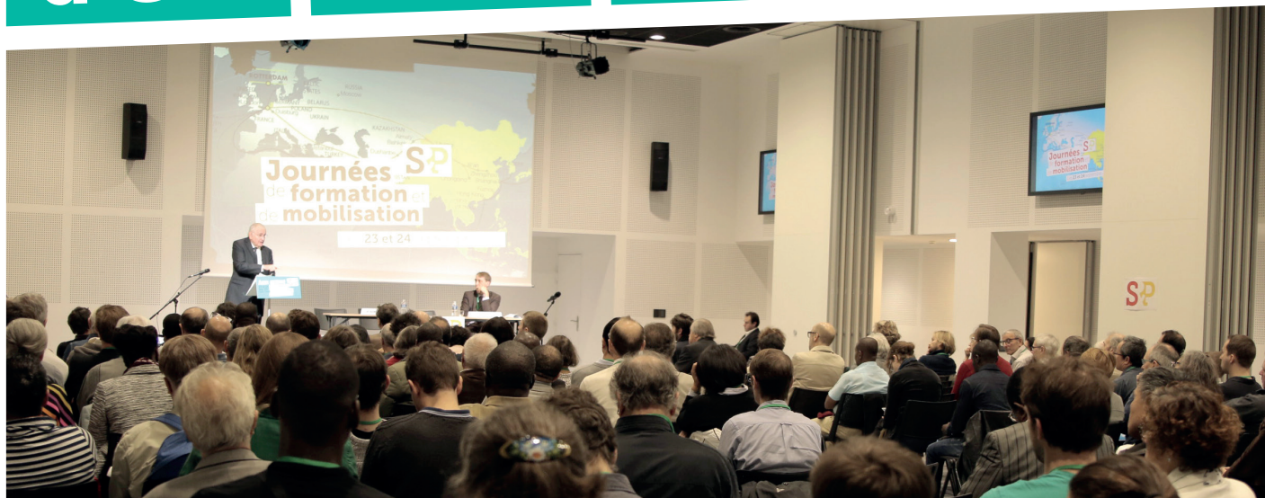
Ne pas jeter sur la voie publique svp

Créons des millions d'emplois productifs !